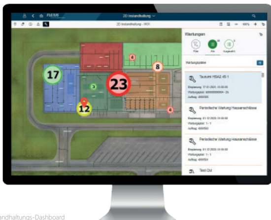
2D-Karte im Instandhaltungs-Dashboard

Über das Flexus Instandhaltungs-Dashboard findet die Überwachung und Administration auf Basis der neuesten SAP-Technologien statt.