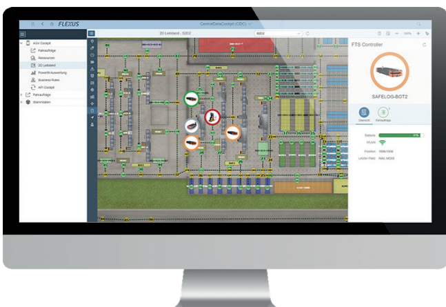
CDC (Central Data Cockpit): Übersicht und Live-Standorte aller AGVs in Ihrem Unternehmen sowie aktuelle Status- und Störmeldungen auf einen Blick

Doch gibt es beim effizienten Materialfluss von AGVs auch Herausforderungen, denen man sich gegenüber sieht. Zum einen ist das der Einsatz mehrerer AGVs verschiedener Hersteller, die Ihr eigenes Flottenmanagement in heterogenen Benutzeroberflächen haben. Des Weiteren müssen Sie diese Fahrzeuge alle passgenau in Ihr etabliertes Materialflusskonzept ohne Leistungsdefizite integrieren. Zum anderen müssen die fahrerlosen Transportmittel zumeist in den gleichen Bereichen agieren wie bemannte Stapler, Routenzüge oder Ameisen. Hierbei ist eine transparente Kommunikation unter den Fördermitteln unumgänglich. Genau um diese Herausforderungen zu lösen, hat die Flexus AG das direkt in SAP integrierte FlexGuide für AGVs entwickelt.